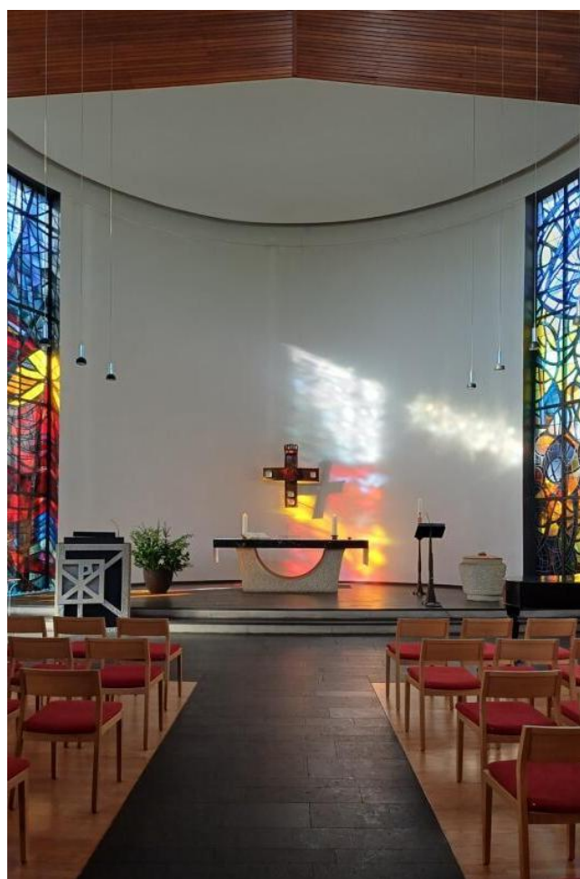
Die Auferstehungskirche in Bad Salzuflen eröffnet den diesjährigen Lippischen Orgelsommer.