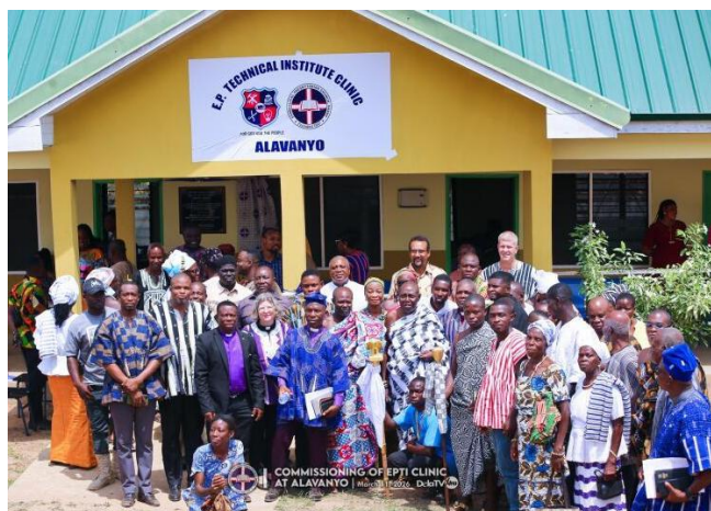
Ans Werk: Eröffnung der neuen Gesundheitsstation in Alavanyo im März 2026.

Alavanyo in Ghana besteht seit mehr als 40 Jahren. Sie geht auf eine kirchlich organisierte Jugendreise zurück, in deren Folge das Detmolder Fair-Trade-Geschäft entstand und sich nach dem Ort benannte. Auch künftig möchte das ehrenamtliche Team des Ladens in Detmold die Partner in Ghana unterstützen. Die Hoffnung ist, dass die Bedeutung der neuen medizinischen Einrichtung in der Region schnell wachsen wird.