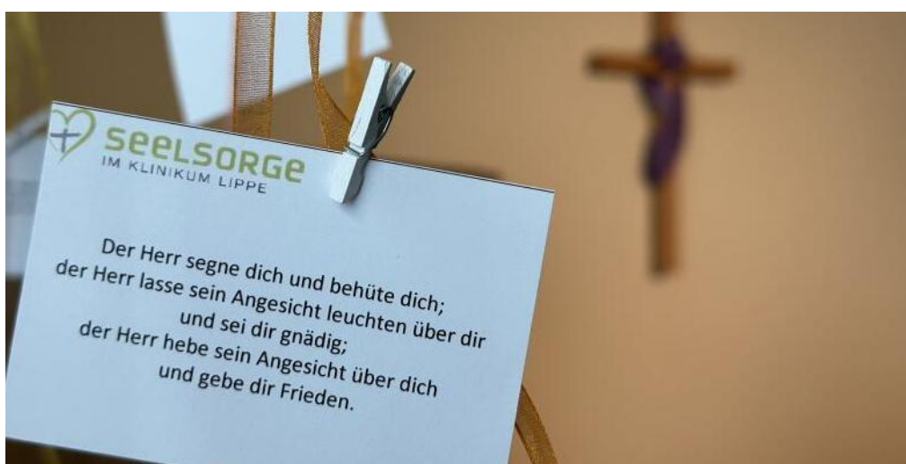
Der Segenskranz im Andachtsraum spendet Trost und Kraft. Jeder kann sich von dort einen Segen mitnehmen.