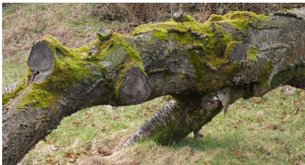
Totholz auf dem Gelände des Rolfschen Hofes: Lebensraum für Insekten.