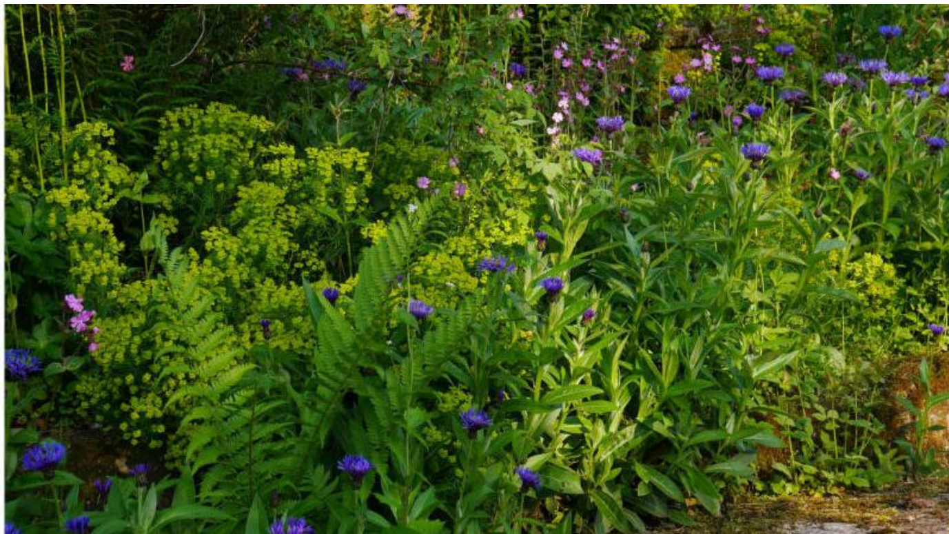
Voller Leben: Der Garten am Rolfschen Hof in Berlebeck.