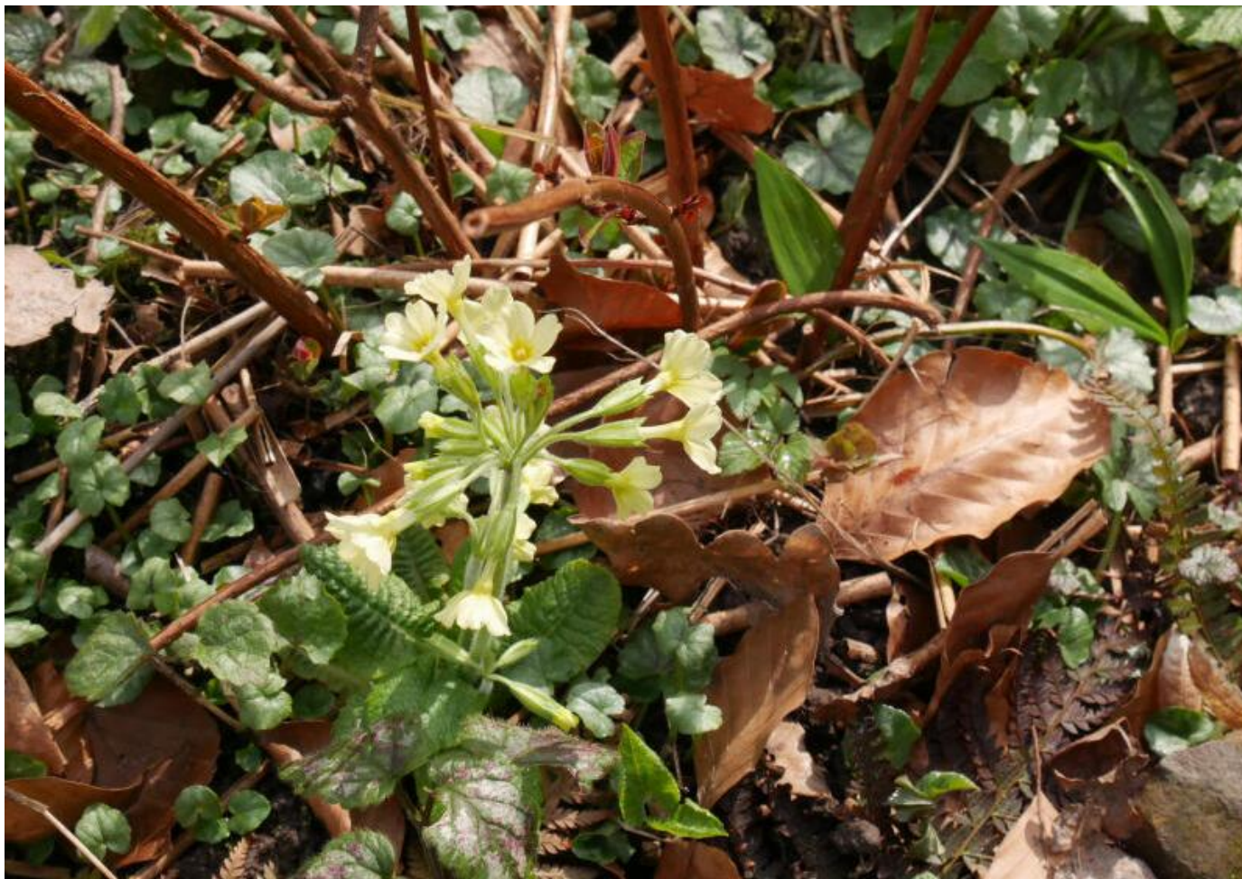
Schon im März zu sehen: Schlüsselblume auf dem Gelände des Rolfschen Hofes.

Auf dem Gelände des Rolfschen Hofes am Hahnberg in Berlebeck kann man sehen, was alles im Teutoburger Wald wächst und blüht – selbst schon bei einem Besuch im März. Da sind Märzenbecher, die sich im feuchten Umfeld des kleinen Teichs auf dem Gelände wohlfühlen. Oder die gelben Schlüsselblumen auf den mit Bruch-